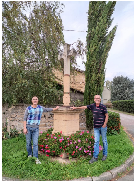
Route de Chevroux