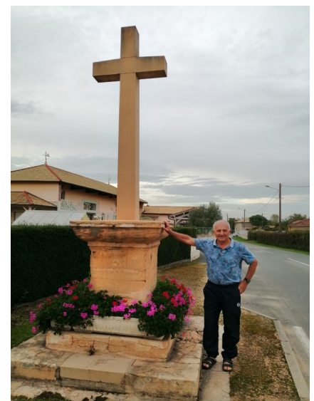
Rue de la Sozaye