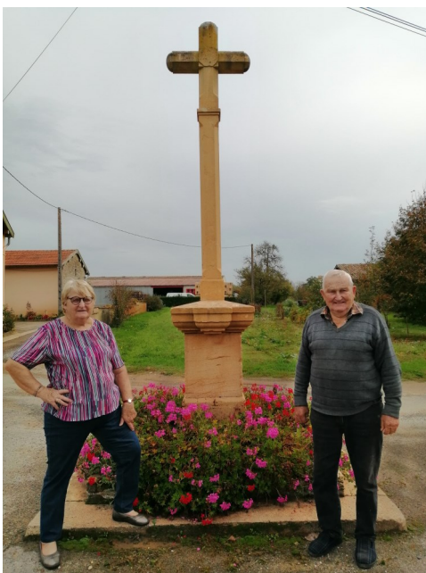
Chemin de Pantoux

Les croix de notre commune sont fleuries et entretenues par les habitants des quartiers concernés. Merci à tous ces bénévoles qui donnent de leur temps pour embellir notre village.