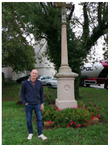
Route de Dommartin