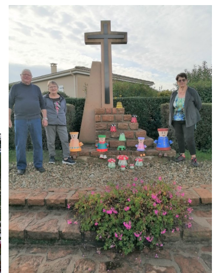
Route des Pinoux