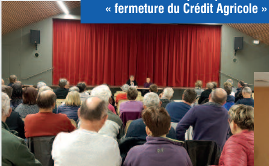
Réunion publique « fermeture du Crédit Agricole »