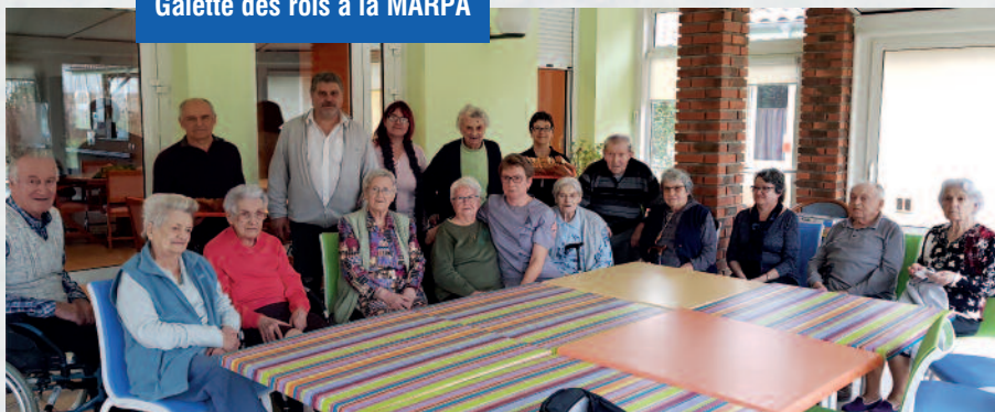
Galette des rois à la MARPA