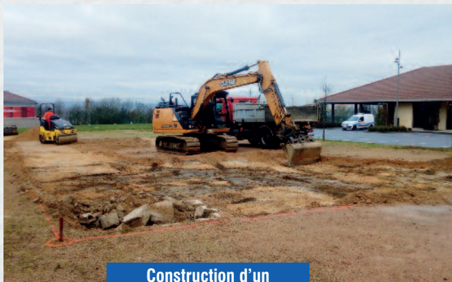
Construction d'un restaurant scolaire