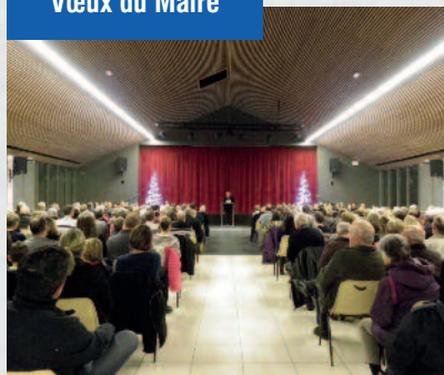
Vœux du Maire