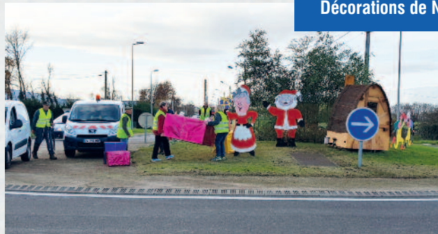
Décorations de Noël