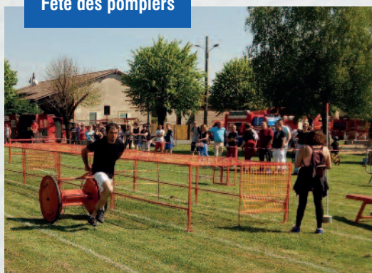
Fête des pompiers