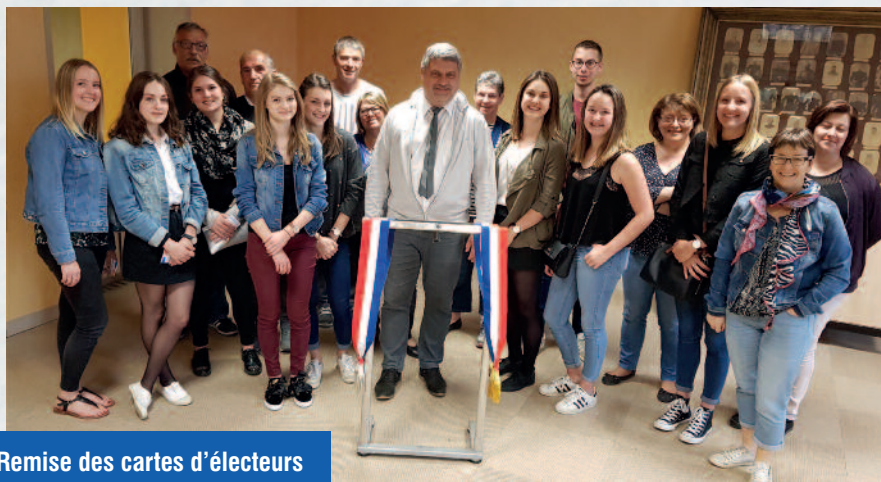
Remise des cartes d'électeurs