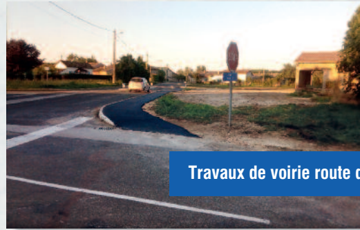
Travaux de voirie route de Chevroux