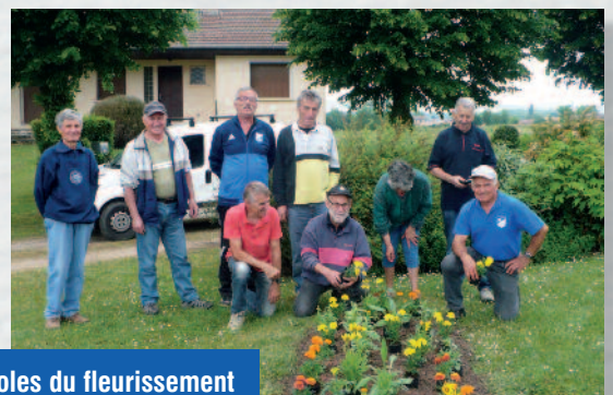
Bénévoles du fleurissement