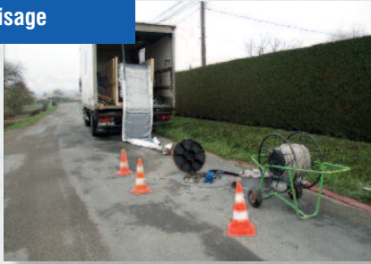
Travaux d'assainissement Chemisage