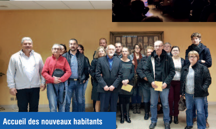
Accueil des nouveaux habitants