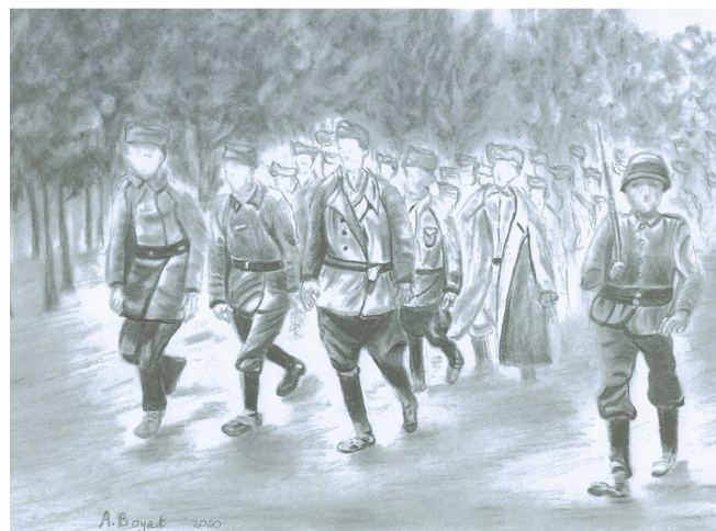
La commune de Manziat et le département de l'Ain entre 1939 et 1945