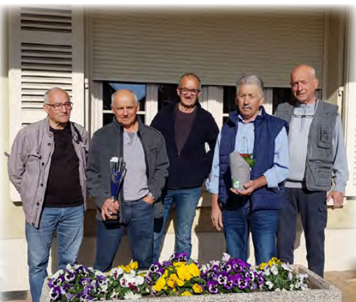
Prix du fleurissement