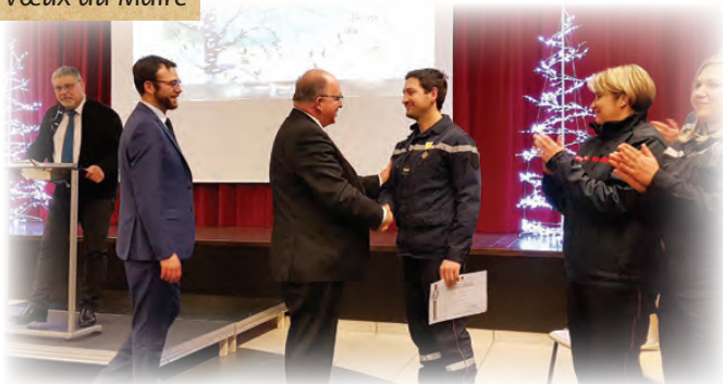
Vœux du Maire