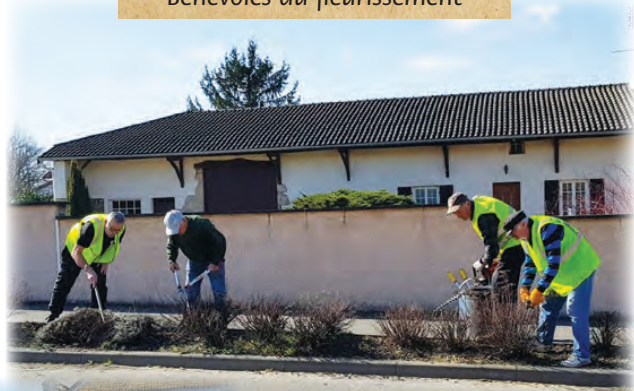
Bénévoles du fleurissement