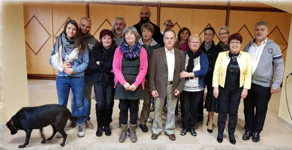
Accueil des nouveaux habitants