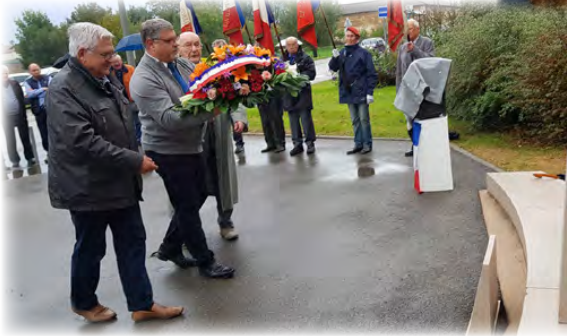
Commémoration de l'envol du Maréchal de Lattre de Tassigny