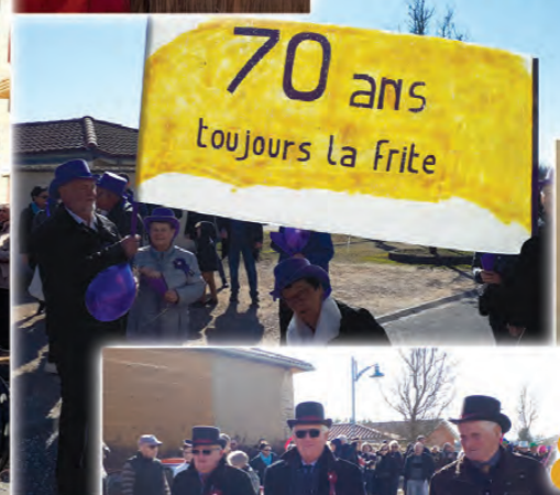
70 ans toujours la frite