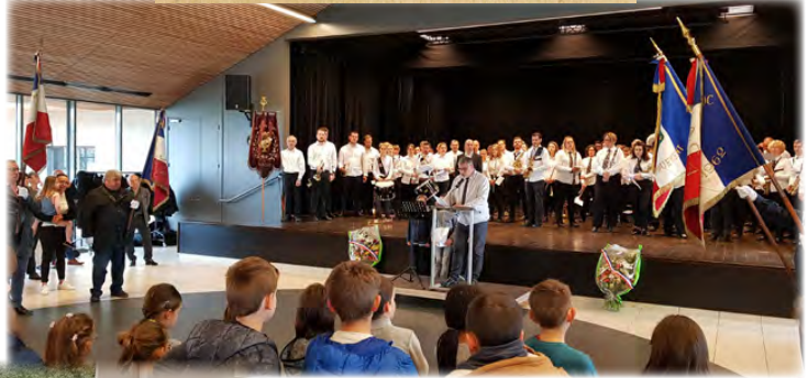
Commémoration du 8 mai 1945