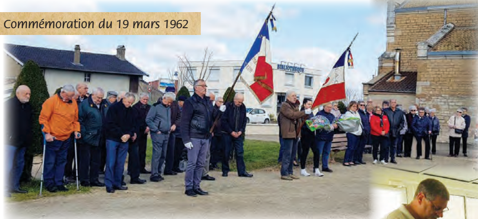
Commémoration du 19 mars 1962