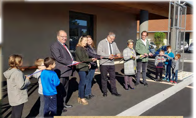
Inauguration du restaurant scolaire