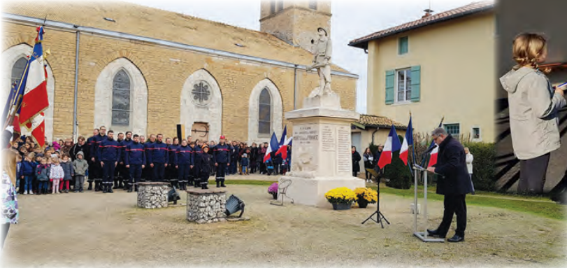
Commémoration du 11 novembre 1918