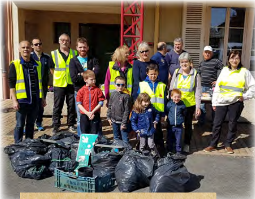
Matinée nettoyage du village